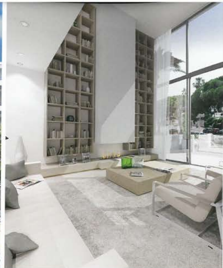
CANNES CROISSETTE - PALM BEACH