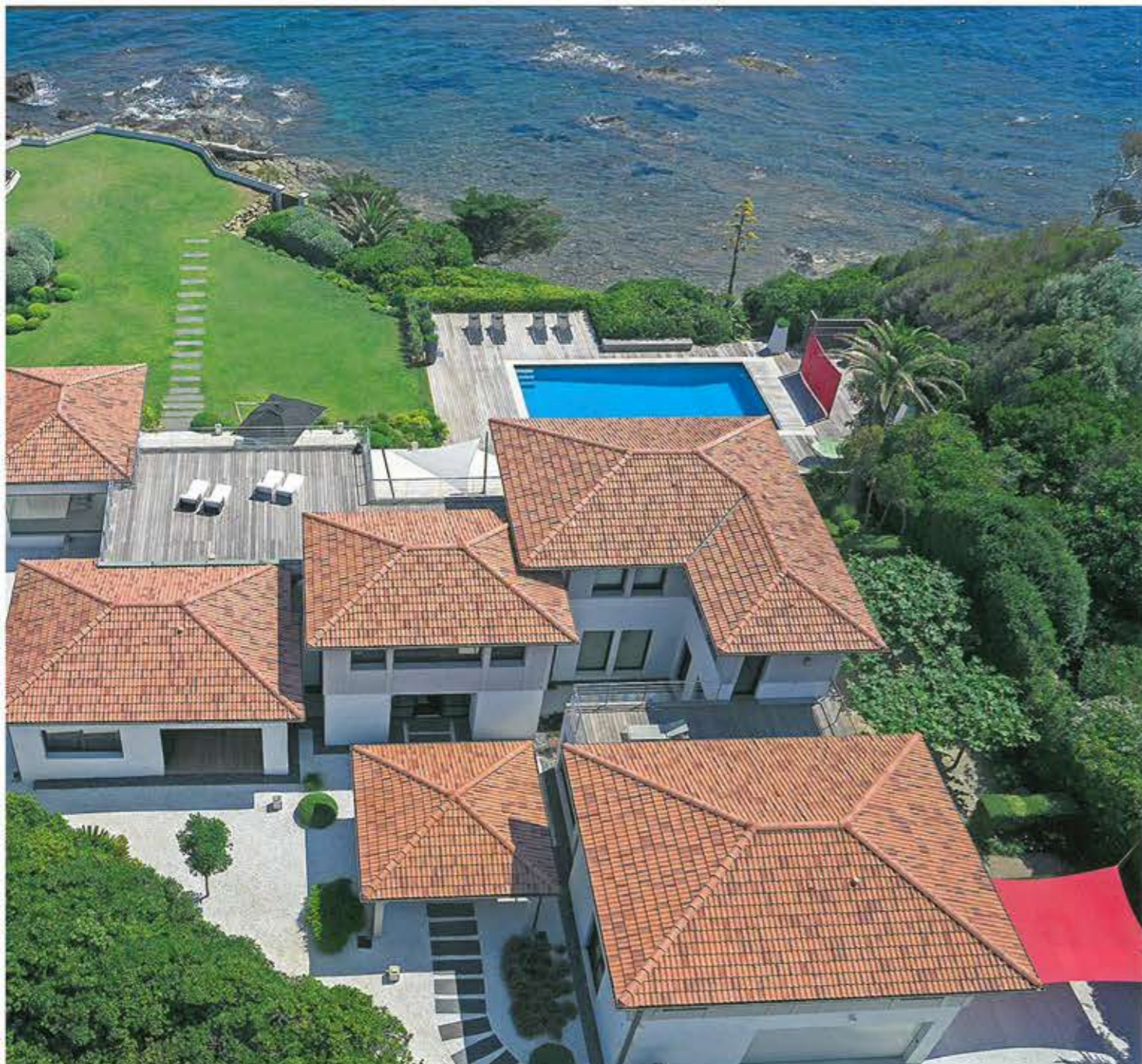
tre Cannes et Saint-Tropez