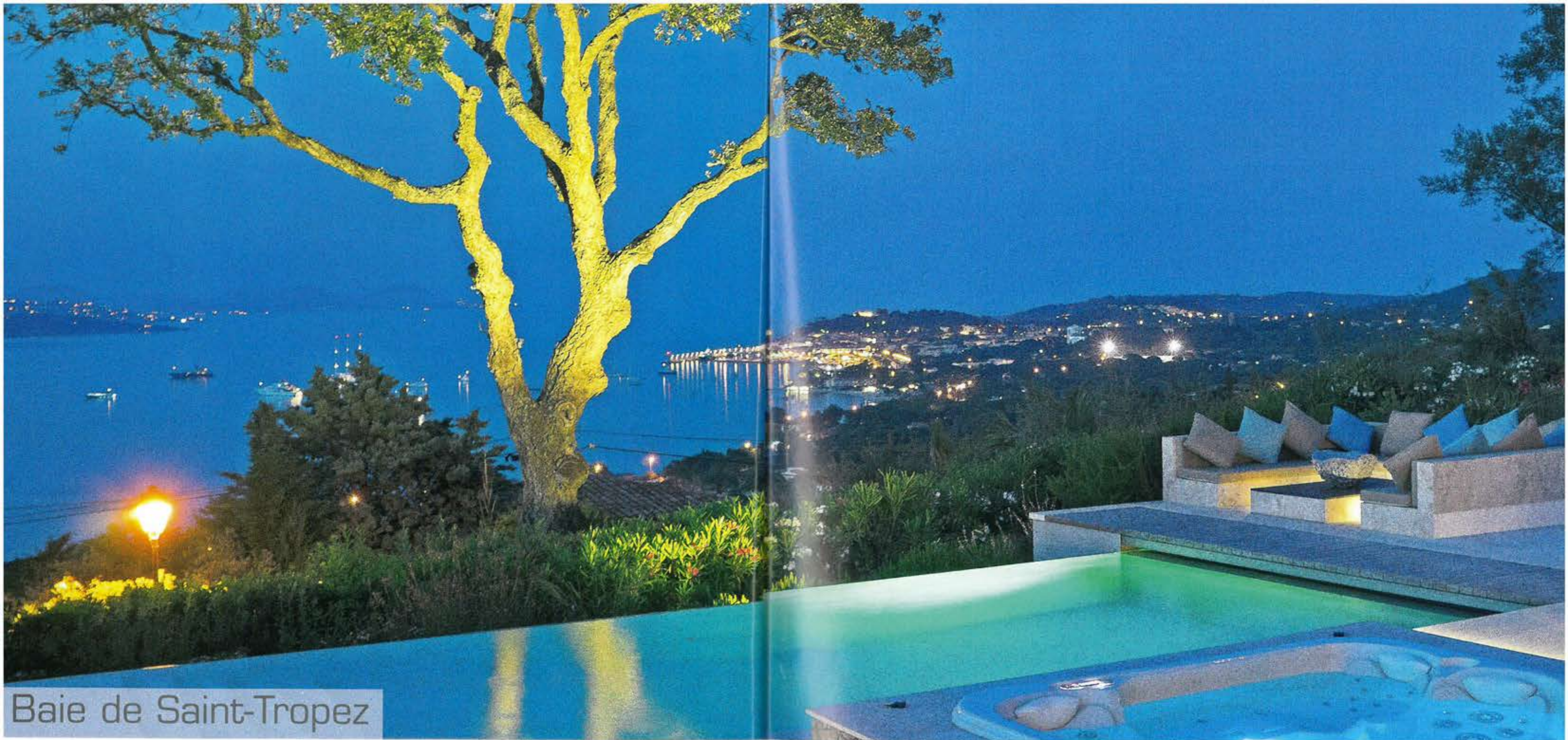
Baie de Saint-Tropez